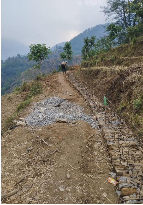
घट्टेखोला पिपलडांडा सिंचाई कूलो, वडा नं. ६