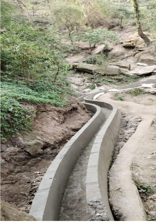
साल्कोट सिंचाई कूलो, वडा नं. ५